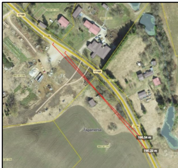
Väljavõtte 23.10.2023 kirja nr 7.1-2/23/20949-2 joonisest 4

Nõue tuleneb asjaolust, et nimetatud ristumiskoht on rajatud omavoliliselt (vastuolu EhS § 99 lg 3), selle mõõtmed ei vasta meie nõuetele (antud asukohas peab ristumiskoht vastama mahasõit tüüp II gabariitidele) ning paremale suunas ei ole võimalik tagada normide kohast 3 \times 190 m nähtavuskaugust. ( väljavõttel märgitud punaste joontega ).