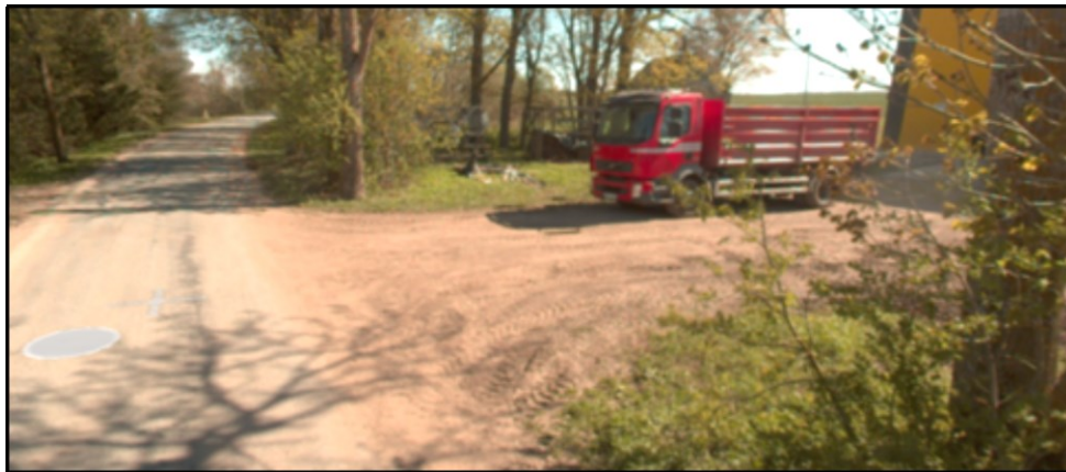
Väljavõtte teevideost (2024 mai)

Peame oluliseks selgitada, et riigitee alusele maale ulatuv ristumiskoht kuulub riigitee koosseisu, mille osas omaniku ülesandeid täidab Transpordiamet. See tähendab, et ristumiskoha rajamine riigiteele (sh asukoha või katendi valik) on Transpordiameti haldusmenetlus. Majandus- ja taristuministri 03.12.2020 määruse nr 82 „Transpordiameti põhimäärus“ § 4 p 1 kohaselt on Transpordiameti põhiülesandeks tingimuste loomine ohutuks ja säästlikuks liiklemiseks ning inimeste ja sõidukite liikuvuse kavandamine. EhS § 70 lg 2 p 1 kohaselt on ehitise (riigitee) kaitsevööndis keelatud ohustada ehitist ja selle korrakohast kasutamist.