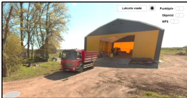
Väljavõte teevideost (2024 mai)