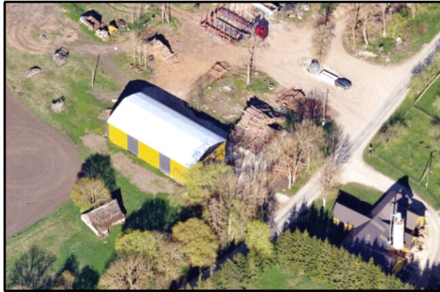
Väljavõte fotolaost (2023 mai)

Maa- ja Ruumiameti fotolao ning teevideo põhjal on tuvastatav, et tenthall on püstitatud enne vastava ehitusloa väljaandmist.